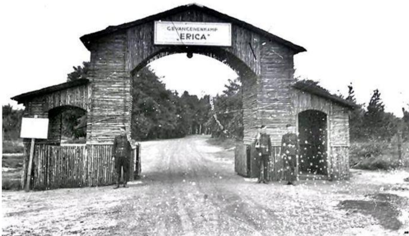
Gevangenkamp Erika in de bossen bij Ommen

Het terrein van Kamp Erika genoot voor de Tweede Wereldoorlog nog faam door de Sterkampen van Krishnamurti. Ommen was het centrum van de theosofische beweging waar mensen uit alle windstreken op af kwamen. Toen de oorlog uitbrak kwamen er werkkampen in heel het land. Kamp Erika kreeg een bestemming als strafkamp doordat de gevangenen overvol kwamen te zitten. Duizenden gevangenen kwamen er tussen 1942 en 1945 terecht.